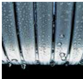
Echangeur de chaleur Inox-radial – durable et efficace