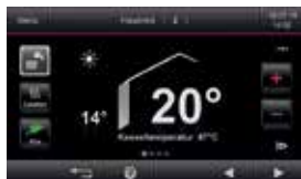
Régulation Vitotronic 200 avec écran tactile couleur

Les chaudières murales gaz à condensation Vitodens 200-W et 222-W sont idéales pour les appartements en copropriété ou les maisons individuelles. Elles peuvent être montées aisément dans une niche de la salle de bain ou bien fixées au mur dans la cuisine.