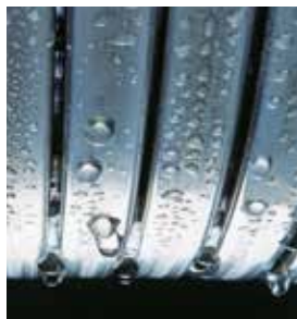
Surface d'échange Inox-radial