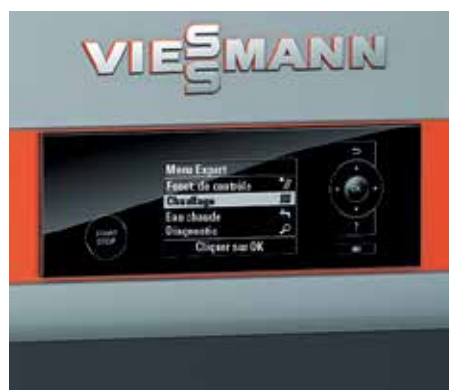
Régulation pilotée par menu de la chaudière bois à gazéification

L'écran tactile Vitotrol 350 permet de commander la chaudière bois à gazéification depuis la pièce d'habitation. Le grand écran 5" au format 16:9 permet d'utiliser la commande très facilement. Il est possible également de remplacer le module de commande intégré dans la chaudière par la version avec écran tactile.