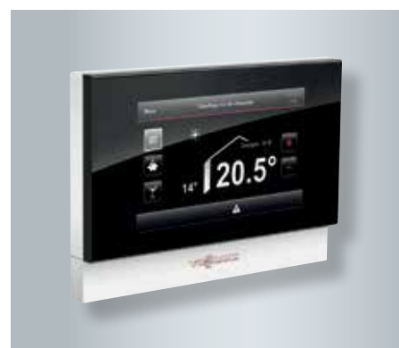
Commande à distance Vitotrol 350 avec écran tactile pour la pièce d'habitation