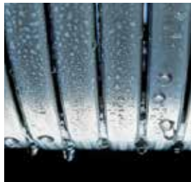
Echangeur de chaleur Inox-radial – durable et efficace