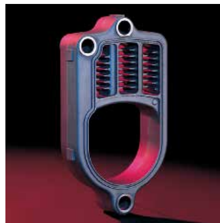
La surface d'échange Eutectoplex garantit une longévité et une sécurité d'exploitation considérables.

La Vitorondens 200-T de 20,2 à 35,4 kW est également disponible avec la régulation constante Vitotronic 100.