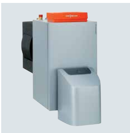
Vitorondens 200-T dans la plage de puissance de 67,6 à 107,3 kW